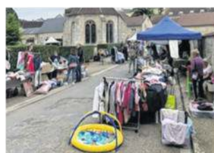
Une vingtaine d'exposants étaient présents.

Belle réussite pour son lancement. Dimanche 5 juin, la municipalité du petit village de Theuville a organisé sa toute première brocante. Une vingtaine d'exposants étaient présents et les chineurs étaient également de la partie. Deux food trucks ont été mobilisés pour l'événement, et ont été dévalisés ! Plusieurs maires des communes voisines, sans oublier le président du Pnr du Vexin français, Benja-