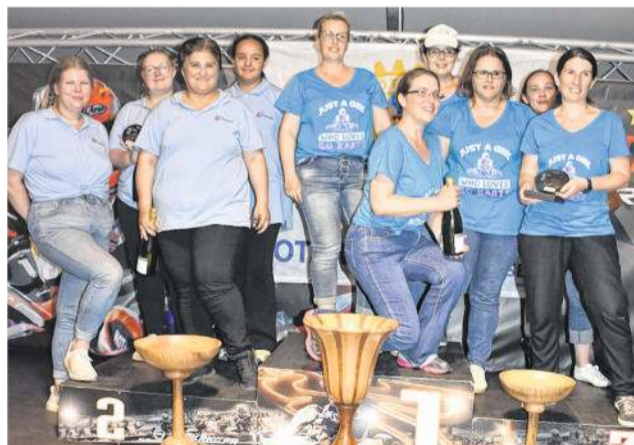
L'équipe Fima Gazelles a remporté le Challenge féminin devant Procarist Ladies et Grégoire Dames.