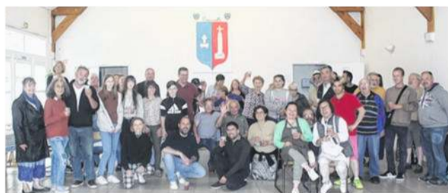
L'événement a battu son plein.

Après deux ans d'absence, la fête des voisins a fait son retour à Omerville. Plus d'une soixantaine d'habitants se sont retrouvés après le marché mensuel des producteurs et artisans locaux.