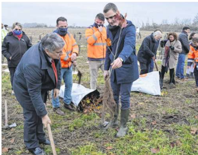
Les élus procédant à de nouvelles plantations de jeunes arbustes, près de la ferme de la Haute-Borne, à Méry-sur-Oise, en décembre 2021.

Une enquête parcellaire est ouverte jusqu'au 1 er juillet. Une nouvelle étape administrative dans ce dossier au long cours, qui vise à reconquérir la plaine polluée de Pierrelaye-Bessancourt, pour la transformer en un massif forestier de 1 400 hectares.