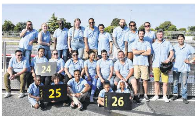
Formation la plus représentée avec 24 pilotes (kids, ados et adultes), Procarist a terminé 2 e du challenge féminin.