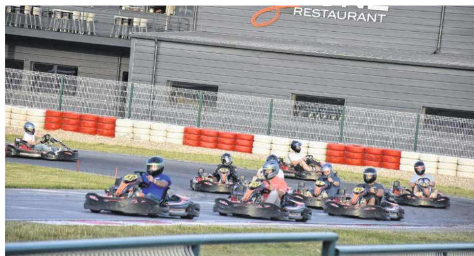
Le 20 e Trophée Paul-Parcillié a rassemblé 320 pilotes. Parmi les 40 équipes de l'épreuve adulte, on retrouve ici CBMI 3 (n° 40), le Rotary Club d'Argenteuil (35), le Rotary Club de L'Isle-Adam (33), Spac 1 (7), Aéro 1 (18), Procarist 2 (25) et Turtle Max 2 (29).