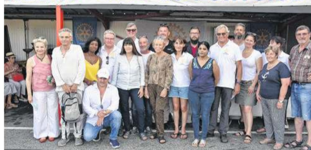
Une partie de l'équipe organisatrice du 20 e Trophée Paul-Parcillié.