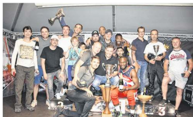
Le Challenge professionnel du 20 e Trophée Parcillié a été remporté par Novuus Team (au centre) devant ABCF Mucoviscidose (à g.) et Peugeot Vauban Saint-Brice (à dr.).